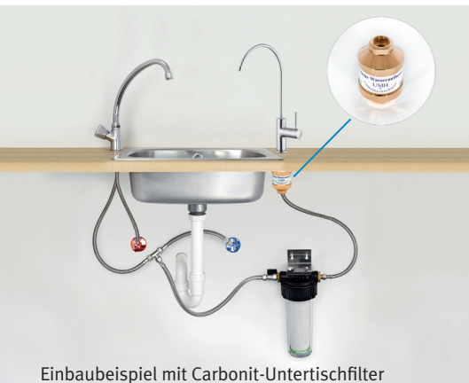
Einbaubeispiel mit Carbonit-Untertischfilter

Ich möchte mich bei Ihnen auf diesem Weg recht herzlich für ein echtes Stück Lebensqualität bedanken. Ich benutze Ihre Produkte mittlerweile seit mehr als zwei Jahren. Sie wissen von meinem Wunsch mich möglichst natürlich zu ernähren, und ich kann heute wirklich sagen, dass ich mich mit meinem Wasser sehr sicher fühle. Mit meinem Untertischfilter bin ich bis heute ausgesprochen zufrieden. Den „Frischekick“ des UMH Wirblers genieße ich wie am ersten Tag. Ich möchte heute kein anderes Wasser mehr trinken.